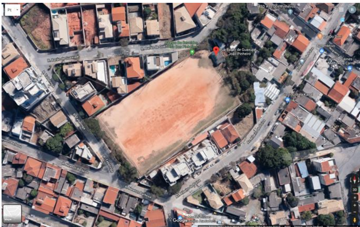
Campo do Reunidos – Alto dos Pinheiros

Na área de esporte, lazer e meio ambiente, destacam-se as modelagens jurídica e econômico-financeira da PBH Ativos para (i) a permissão de 02 (dois) campos de futebol cuja licitação está na fase interna e (ii) a concessão dos serviços turísticos, de alimentação, de estacionamento e de parque esportivo do Parque das Mangabeiras, também na fase interna da licitação.