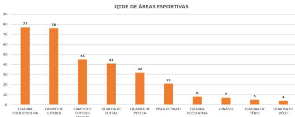
Figura 02 – Quantidade de equipamentos urbanos geridos pelo Poder Concedente.

A figura 2 ilustra a distribuição destas instalações.