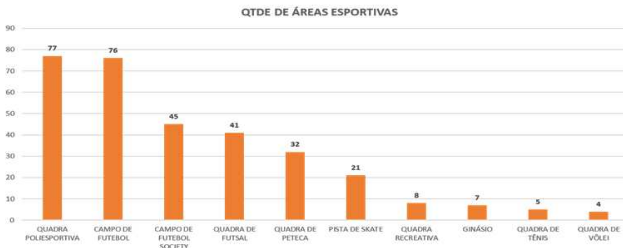
Figura 02 – Quantidade de equipamentos urbanos geridos pelo Poder Concedente.

A figura 2 ilustra a distribuição destas instalações.